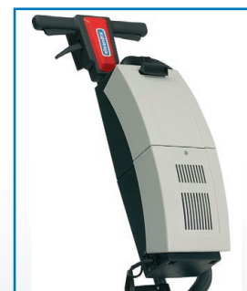
AS 05, aspirateur (option)