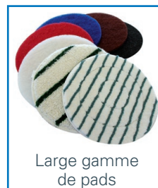
Large gamme de pads