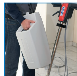
Montage et démontage simple du réservoir à lessive (option)