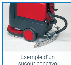
Exemple d'un suceur concave