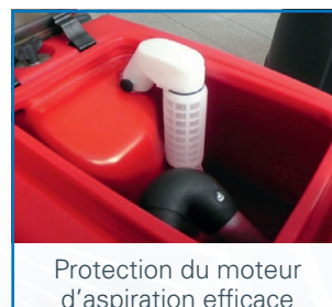
Protection du moteur d'aspiration efficace