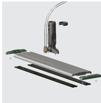
Monture velcro distribution intégrée K2-MD