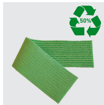
8540 Bandeau lavable 200 fois Tissage accordéon (Patented) 700% d'absorption Elimine jusqu'à 99,99% des bactéries à la surface