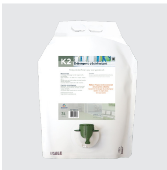
Détergent désinfectant K2-DD3L concentré 3l