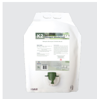
Détergent désodorisant K2-D03L concentré 3l K2-D01.5L concentré 1.5l