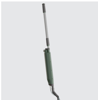
Balai réservoir K2-BR

Toutes les pièces détachées du K2 sont changeables et réparables pour permettre une durabilité maximale du matériel.