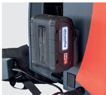
Logement de la batterie sur le côté de l'aspirateur