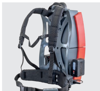
Cadre de transport ergonomique