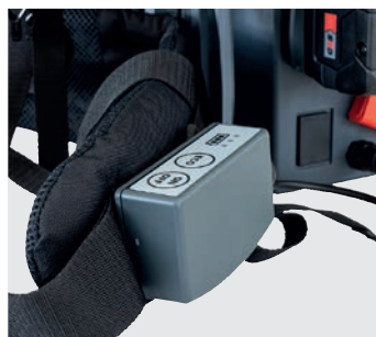
Unité de commande sur la bretelle