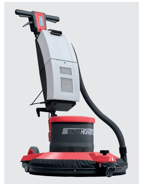
Avec AS 05 aspirateur (en option)