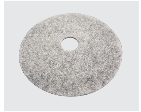
Pad High-Speed fibre naturelle (en option)