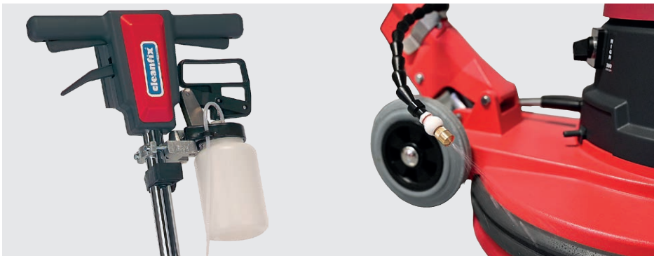
Pulvérisateur permettant un dosage précis et homogène du produit nettoyant (en option)