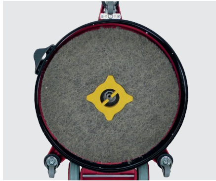
Machine avec plateau d'entraînement intégré